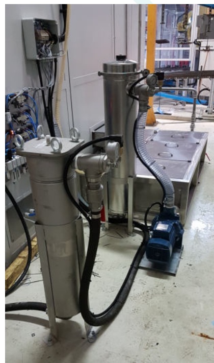
Filtrazione a doppio stadio e controlli per reintegro acqua trattata a tank pompa booster