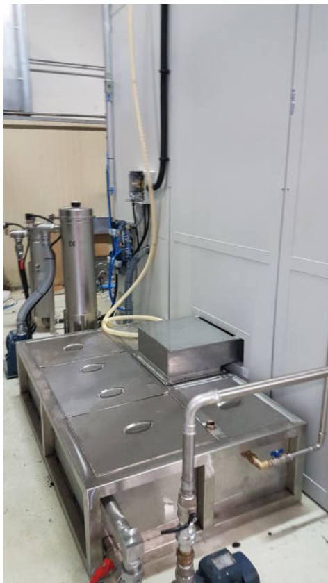
Vasca di pre-filtrazione all-inox a ricircolo con selezione vani di contenimento