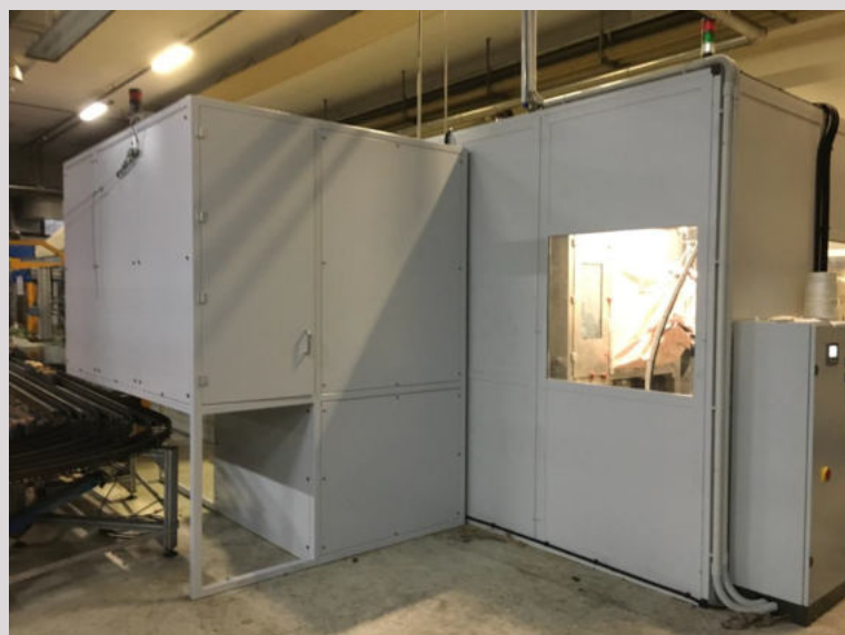
Up grade impianto applicazione di speciale tunnel silente in ingresso pezzi