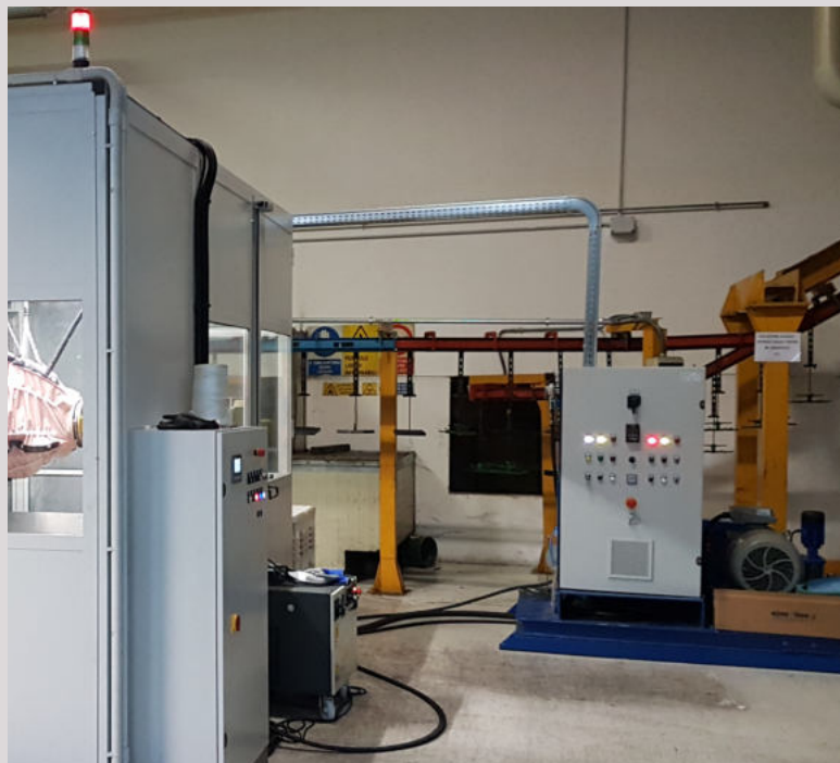
Gruppo pompa alta pressione - equipaggiamento ULTRA CLEAN su skid serie 2500 bar – potenza 45Kw